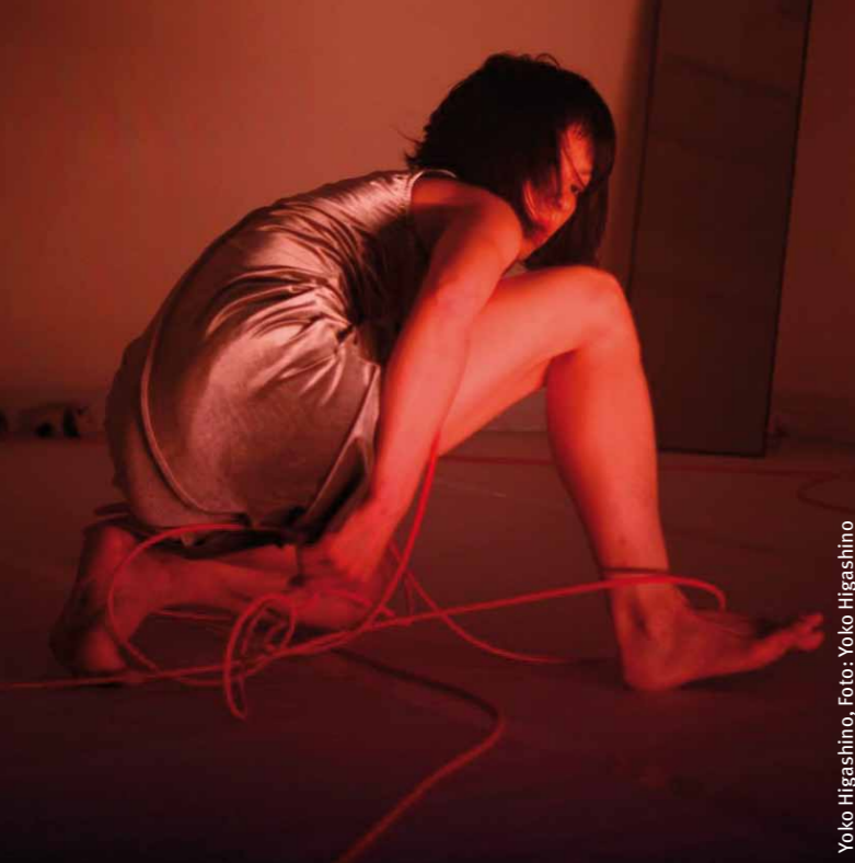
Yoko Higashino